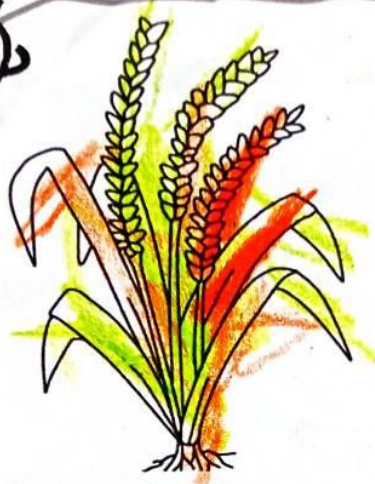
ข้าวเปลือก